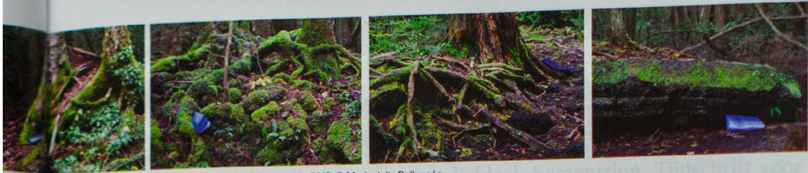
Marie Julia Bollansée, Aokigahara (maquette), 2019, © Marie Julia Bollansée

Eindeel, Septentrion, Tijdschrift voor Diplomatie en de Nederlandse bladen Museumjournaal en Kunstbeeld. Hij was medeoprichter van Middelheim Promotors, eerste directeur van het Internationaal Cultureel Centrum voor de Provincie Antwerpen, lid van de Vrienden van de Provincie Antwerpen, voorzitter van de Provincie Antwerpen voor het Museum voor fotografie. In 1962 ontving hij als eerste de prijs van de TV-kritiek en de Sinjaalprijs voor de promotie van de Provincie Antwerpen. In 1983 werd hij bekroond met de Bert Leysenprijs voor zijn televisiewerk.